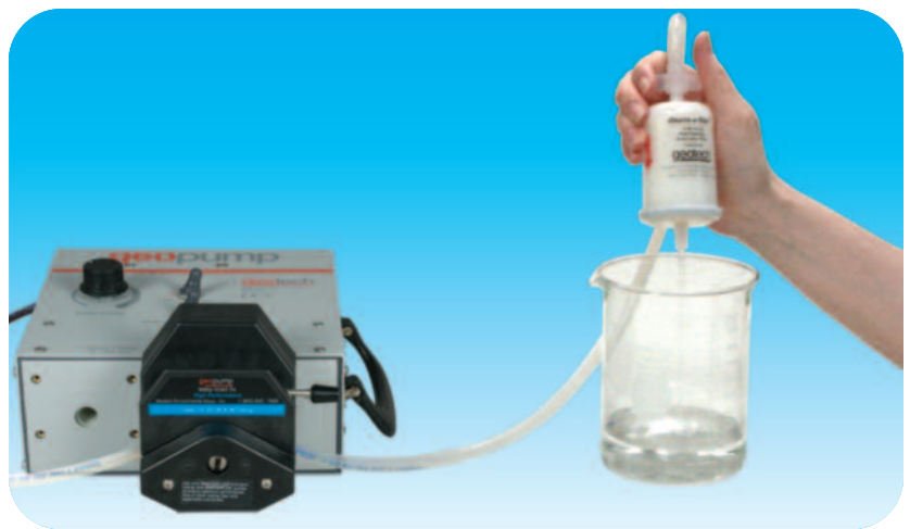
使用Geopump™蠕动泵系列II采样示意，图中包括可选项易装型泵头（容器过滤器单独出售）