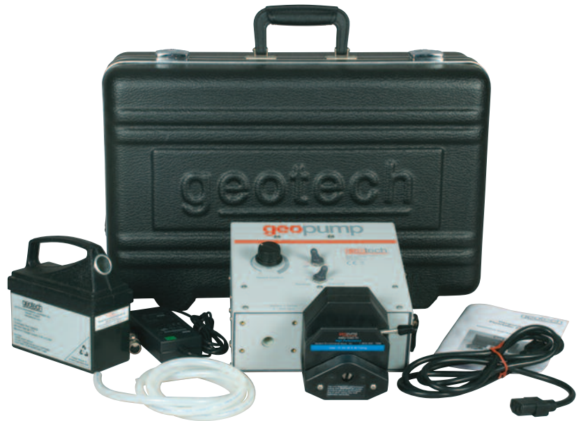
Geopump™蠕动泵系列II配套，包括可选项易装型泵头，电池，5英尺（1.5米）吸管，手提箱和电源线