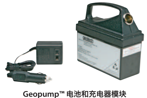
Geopump™ 电池和充电器模块